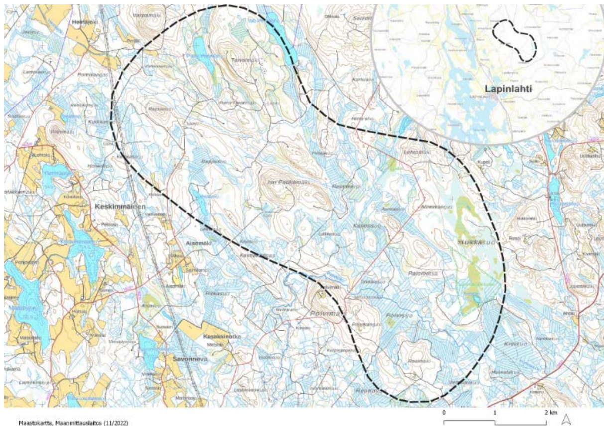
Kaava-alueen sijainti

Tuulivoimahankkeeseen sovelletaan Ympäristövaikutusten arvioinnista annetun lain (YVA-laki) mukaista ympäristövaikutusten arviointimenettelyä. Tuulivoimahankkeen kaavoitus ja YVA-menettely toteutetaan erillisinä, mutta samanaikaisina prosesseina.