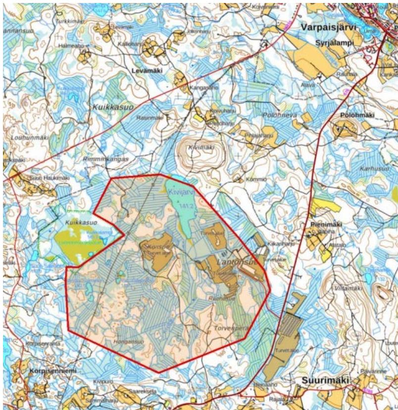
Kaava-alueen sijainti

Suunnittelualue sijaitsee noin 4 km Varpaisjärven taajamasta lounaaseen ja noin 14 km Lapinlahden kuntakeskuksesta kaakkoon. Kaava-alueen pinta-ala on noin 760 ha ja se sijoittuu Kivimäen, Pienimäen, Suurimäen, Korpisenniemen ja Kuikkasuon väliselle alueelle. Yleiskaava laaditaan MRL:n 77a §:n mukaisesti ja sen laadinnan tavoitteena on mahdollistaa Savolan tuulivoimapuiston rakentaminen luonnon ympäristön ominaispiirteet ja ympäristövaikutukset huomioon ottaen ja siten lieventää rakentamisesta mahdollisesti aiheutuvia haitallisia vaikutuksia. Alueelle on suunnitteilla enintään 5 tuulivoimalan tuulivoimasto.