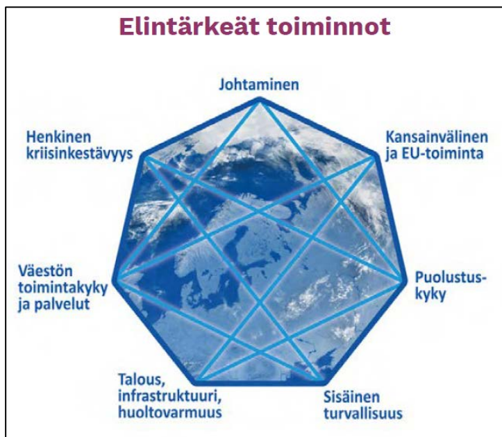
Elintärkeät toiminnot (YTS 2017)

Yhteiskunnan turvallisuusstrategiasta (YTS 2017) johdetut kunnan elintärkeät toiminnot ohjaavat Lapinlahden kunnan varautumisen suunnittelua kaikilla toimintatasoilla. Yhteiskunnan turvallisuusstrategian mukaan kunnat, viranomaiset, elinkeinoelämä, järjestöt ja kansalaiset yhteistyössä huolehtivat suomalaisen yhteiskunnan kokonaisturvallisuudesta ja yhteiskunnan elintärkeiden toimintojen jatkuvuudesta.